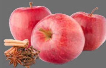
Apfel naturtrüb Punsch Sirup

ALKOHOLFREIER PUNSCH. FÜR DIE KALTE JAHRESZEIT.