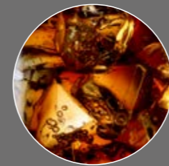
Kola Limonade Sirup