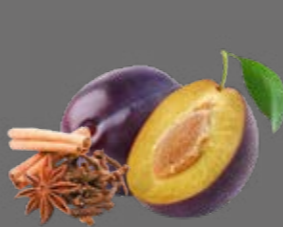
Zwetschgen Punsch Sirup