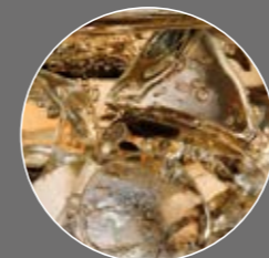
Kräuter Limonade Sirup