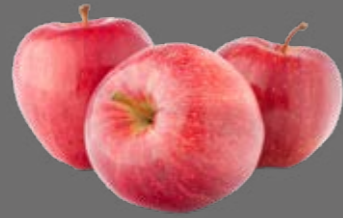
Apfelsaft Konzentrat klar od. naturtrüb