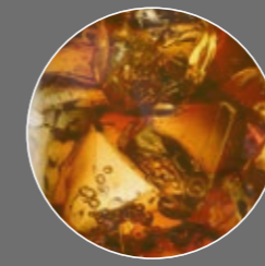
Kola-Orangen Mix Limonade Sirup