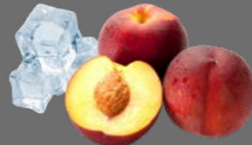
Pfirsich Eistee Sirup