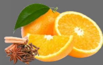
Orange-Ingwer Punsch Sirup