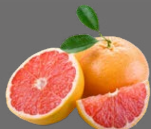
Pink Grapefruit Sirup