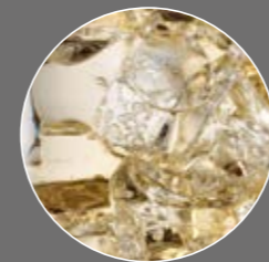
Zitronen Limonade Sirup