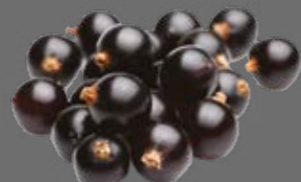
Schwarzer Johannisbeer Sirup