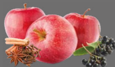
Apfel-Holunderbeere Punsch Sirup